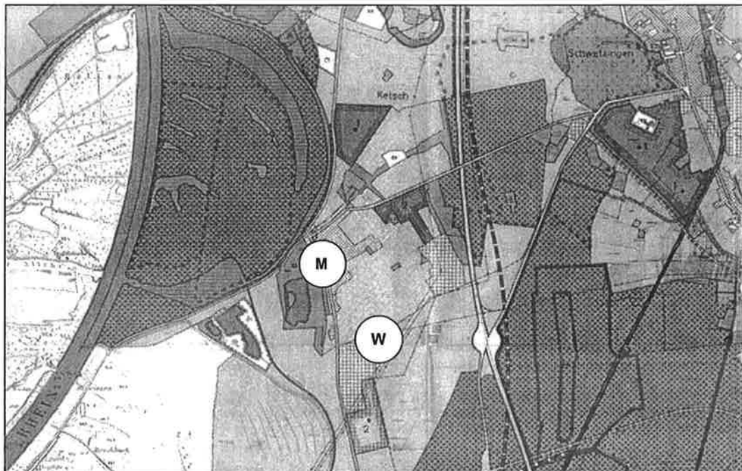
Abb. 1: Ausschnitt aus dem Flächennutzungsplan 1982/1983 des Nachbarschaftsverbandes Heidelberg-Mannheim Im aktuellen Flächennutzungsplan der Gemeinde Ketsch aus dem Jahr 1982 4 , der die Nutzung der Gemeindefläche in ihren Grundzügen darstellt, ist das Untersuchungsgebiet des städtebaulichen Rahmenplans (zur näheren Erläuterung siehe Kapitel 3.1) vorwiegend als Wohnbaufläche und in einem nordwestlichen Teilbereich, bei dem es sich um den Altortbereich und sein näheres Umfeld handelt, als Mischbaufläche dargestellt.