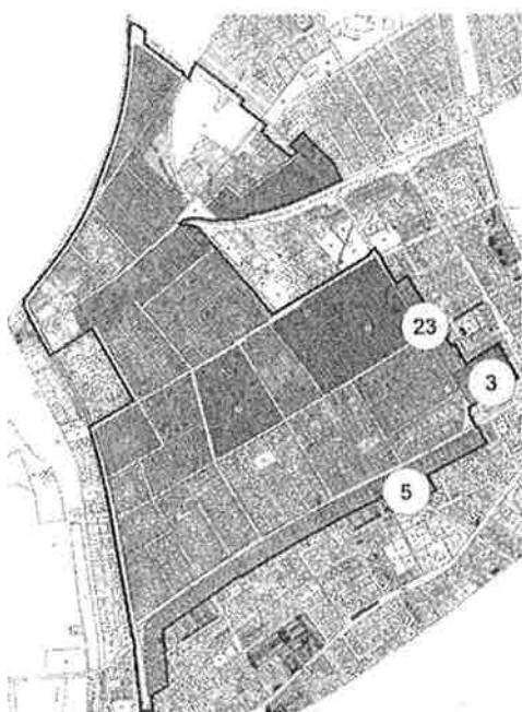
Abb. 2: Handlungskonzept mit Kennzeichnung der innerhalb des vorliegenden Teilbebauungsplanes liegenden Strukturbereiche

Der Bebauungsplan „Ortskern - Teilbereich F“ umfasst die Teilbereiche 3, 5 und 23 des bereits erstellten Handlungskonzeptes. Dabei sind folgende Straßenzüge der Gemeinde Ketsch betroffen: Hardtwaldstraße, Hebelstraße, Schriesheimer Straße, Hockenheimer Straße, Schulstraße, Enderlestraße, Goethestraße, Kolpingstraße sowie die Seestraße.