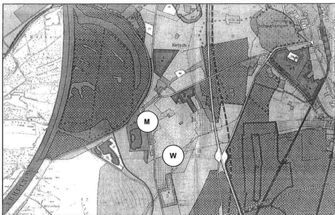
Abb. 1: Ausschnitt aus dem Flächennutzungsplan 1982/1983 des Nachbarschaftsverbandes Heidelberg-Mannheim Im aktuellen Flächennutzungsplan der Gemeinde Ketsch aus dem Jahr 1982 4 , der die Nutzung der Gemeindefläche in ihren Grundzügen darstellt, ist das Untersuchungsgebiet des städtebaulichen Rahmenplans (zur näheren Erläuterung siehe Kapitel 3.1) vorwiegend als Wohnbaufläche und in einem nordwestlichen Teilbereich, bei dem es sich um den Altortbereich und sein näheres Umfeld handelt, als Mischbaufläche dargestellt.